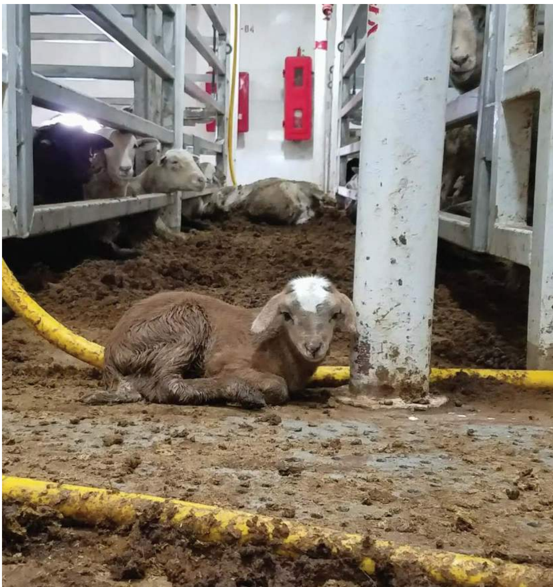
14. התחקיר מגלה גם את ההשפעה של ים סוער.

ניתן לראות כיצד בים סוער האוניה מיטלטלת טלטלות חזקות, ובעלי החיים במכלאות נוטים מצד לצד, מתקשים לשמור על יציבתם ומועדים.